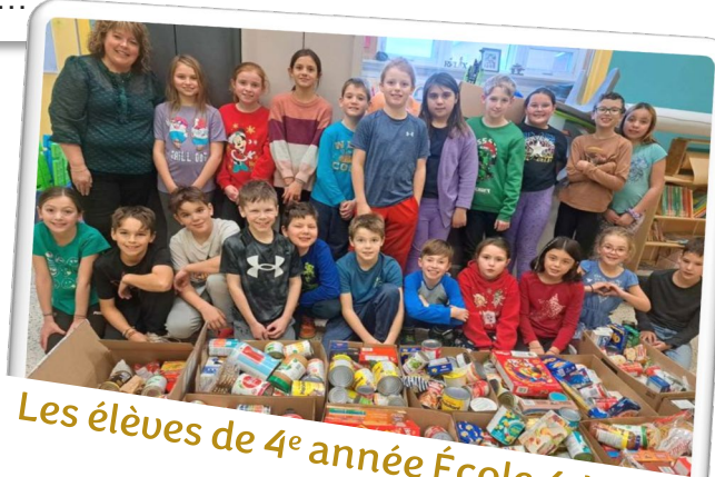
Les élèves de 4 e année École 4-Vents